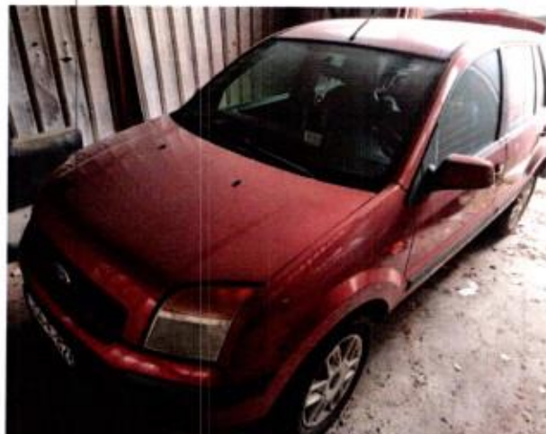
Slika 6. Prikaz putničkog automobila sa prednje lijeve strane