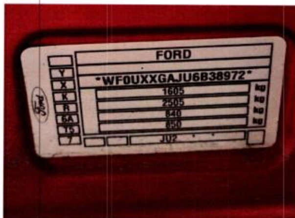
Slika 4. Prikaz pločice proizvođača