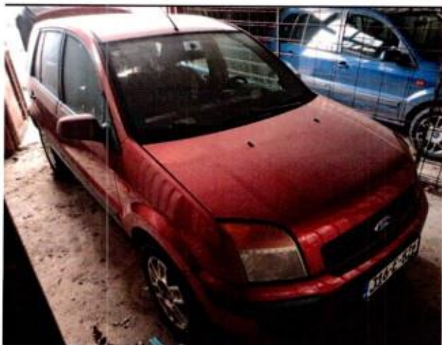
Slika 5. Prikaz putničkog automobila sa prednje desne strane