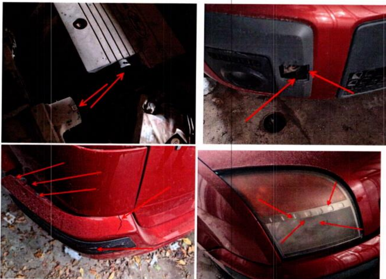
Slike 10-13. Oštećenja na putničkom automobilu Ford FUSION