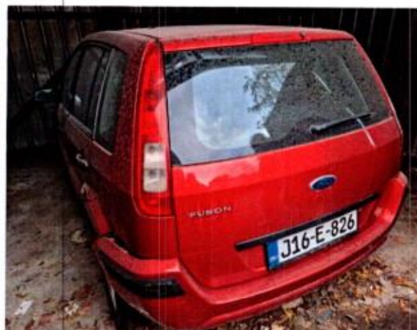
Slika 8. Prikaz putničkog automobila sa zadnje lijeve strane