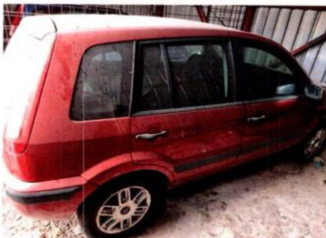
Slika 7. Prikaz putničkog automobila sa zadnje desne strane