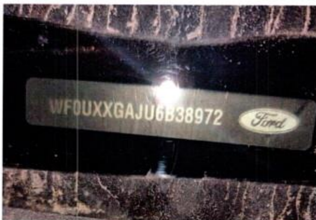
Slika 3. Prikaz broja šasije vozila