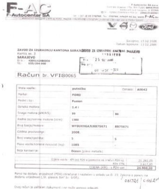
Slika 9. Prikaz računa nabavke putničkog automobila Ford Fusion (M20-J-757)

Prikaz računa je dat na slijedećoj slici.