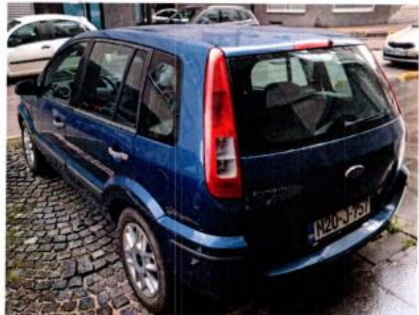
Slika 8. Prikaz putničkog automobila sa zadnje lijeve strane