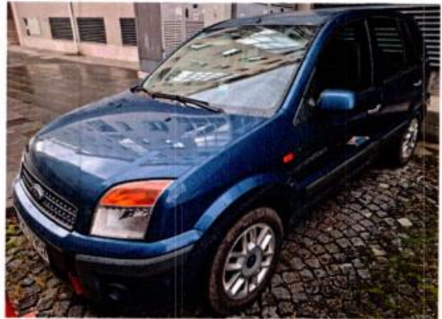
Slika 6. Prikaz putničkog automobila sa prednje lijeve strane