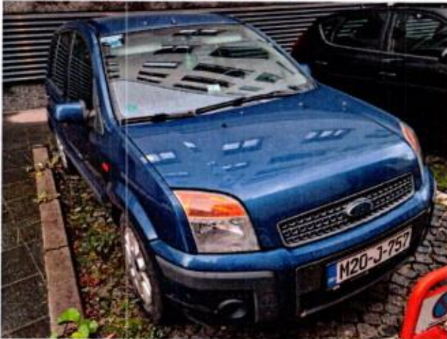
Slika 5. Prikaz putničkog automobila sa prednje desne strane