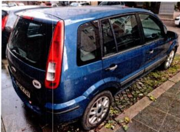
Slika 7. Prikaz putničkog automobila sa zadnje desne strane