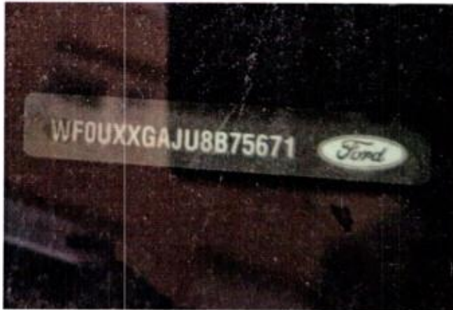
Slika 3. Prikaz broja šasijske vozila