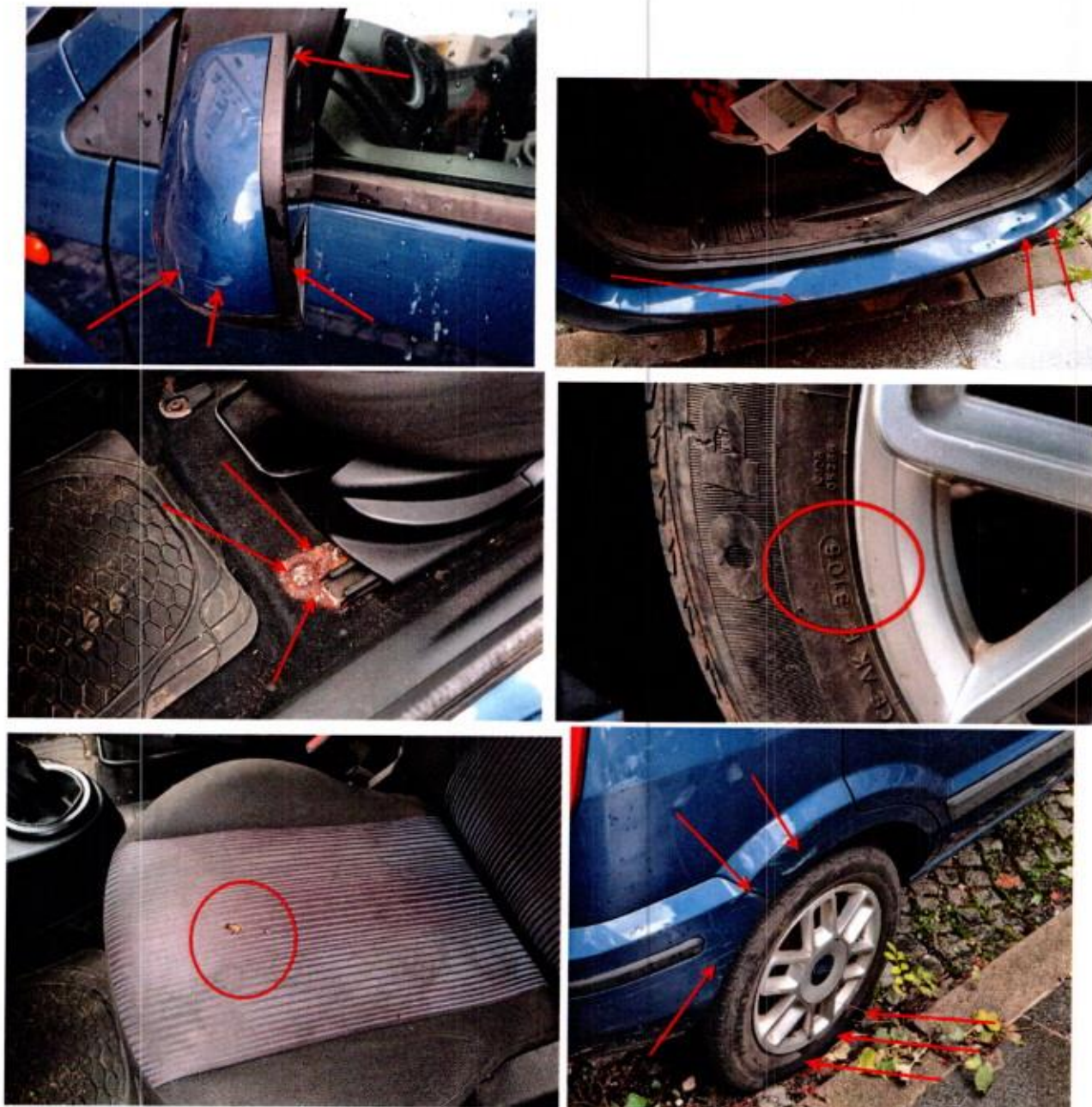
Slike 11-18. Oštećenja na putničkom automobilu Ford FUSION

Shodno navednom izvršena je korekcija amortizacije po osnovu općeg stanja vozila, odnosno amortizacija je uvećana za 2%.