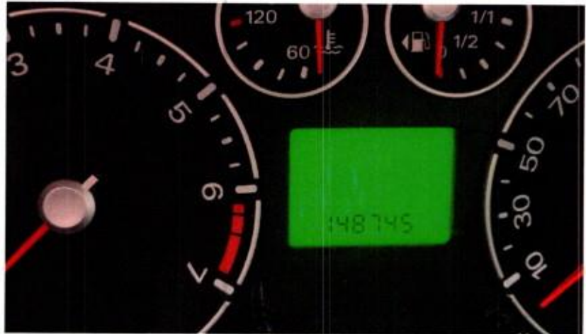
Slika 10. Prikaz pređene kilometraže za vozilo Ford Fusion

Amortizacija po faktoru pređene kilometraže 0 % - vozilo staro preko 10 godina.