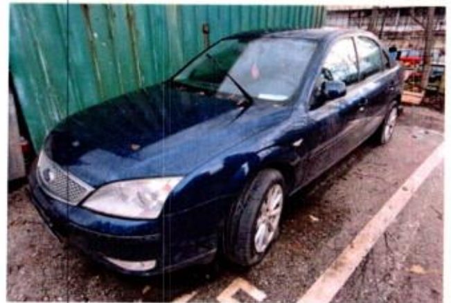
Slika 6. Prikaz putničkog automobila sa prednje lijeve strane