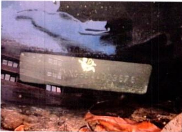
Slika 3. Prikaz broja šasijske vozila