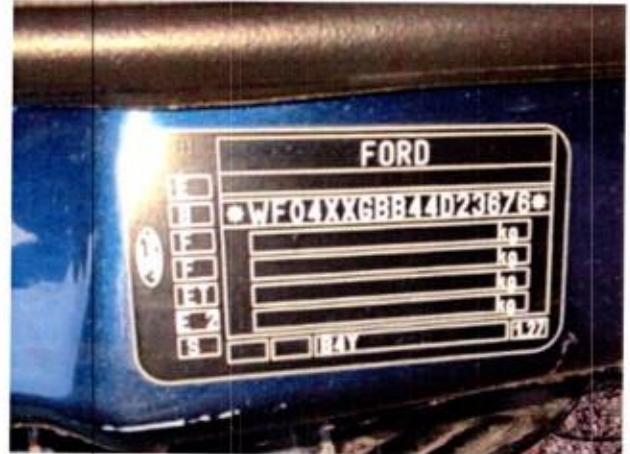
Slika 4. Prikaz pločice proizvođača