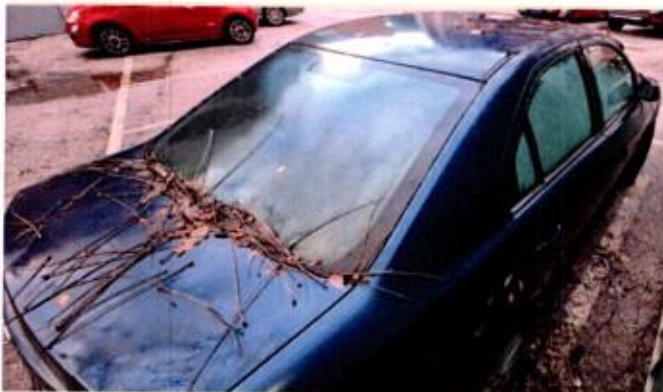
Slika 7. Prikaz putničkog automobila sa zadnje desne strane