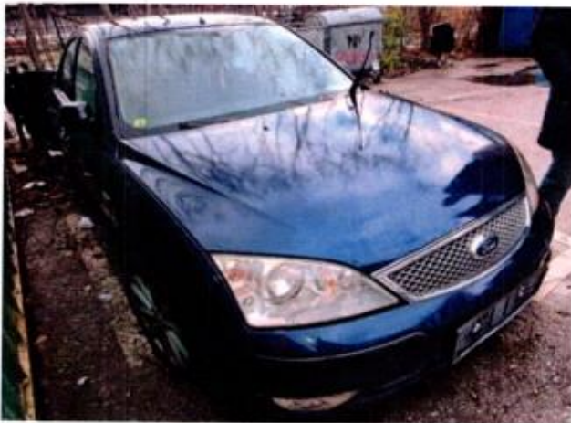
Slika 5. Prikaz putničkog automobila sa prednje desne strane