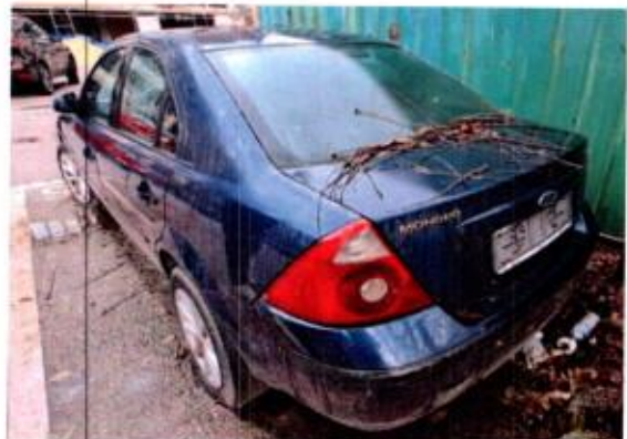
Slika 8. Prikaz putničkog automobila sa zadnje lijeve strane