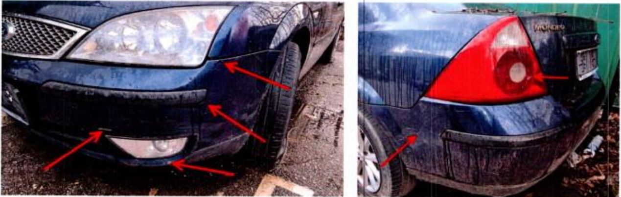
Slike 10-15. Oštećenja na putničkom automobilu Ford Mondeo

Shodno navednom izvršena je korekcija amortizacije po osnovu općeg stanja vozila, odnosno amortizacija je uvećana za 9%.